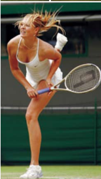
La nova nina russa