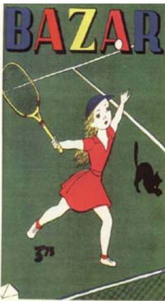
(Bazar, revista de la Sección Femenina, octubre de 1950.)

(Jaime Armengol, presbítero, El libro de los padres , 1948.)